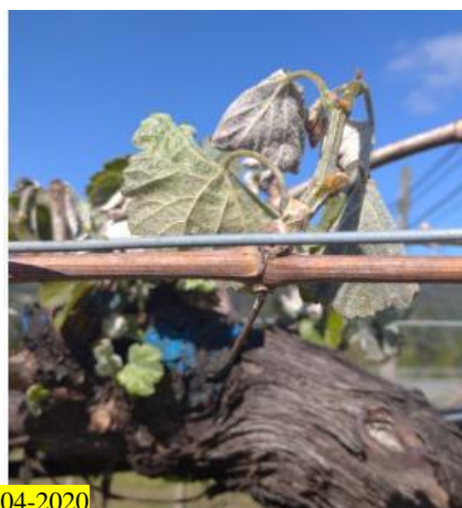
DO Rías Baixas-subzona Condado 01-04-2020